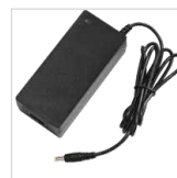
Nabíjecí jednotka 230 V a síťový kabel