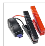
Chytrý propojovací kabel