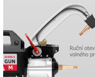
Ruční otevření ramene pro zajištění volného prostoru 200 mm