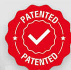
Patent GYS: Ruční otevření