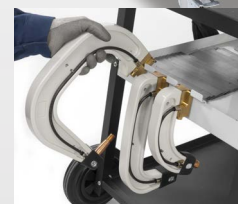
Integrovaná opěrka ramen